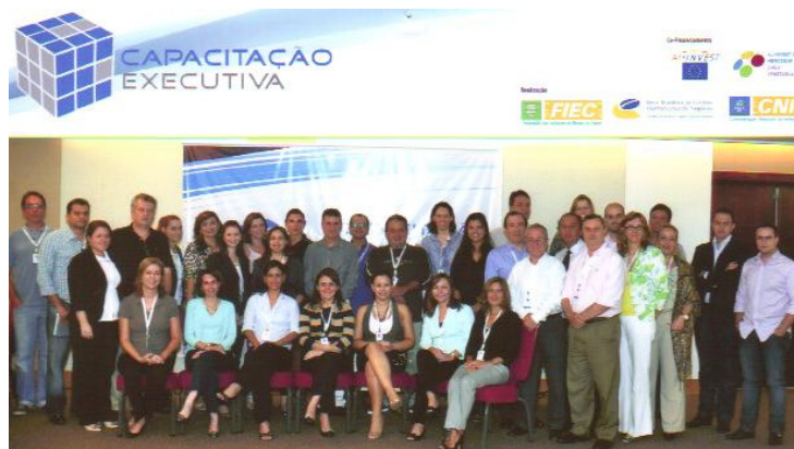
Los participantes del curso empresarial

Mediante un ambiente dinámico y participativo, los participantes pudieron aprender las diversas prácticas de gestión, posibilitando un continuo perfeccionamiento gracias a las informaciones estratégicas que facilitan la toma de decisiones.