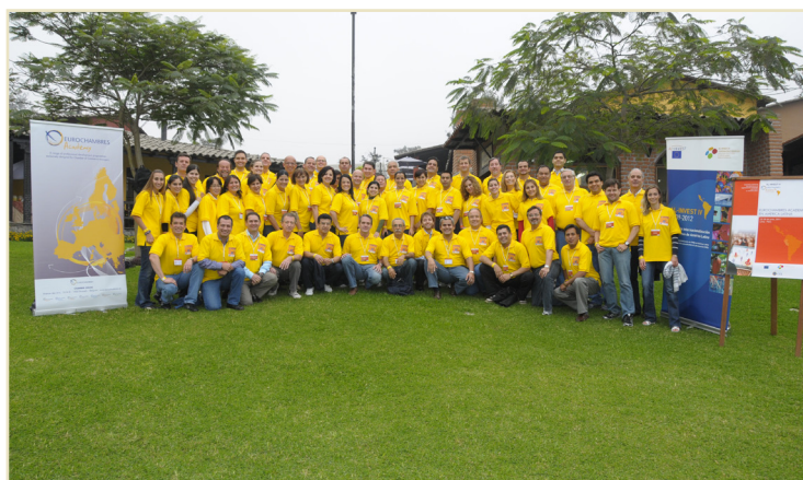
Participantes del 'Academy' América Latina 2011

El 'Academy' América Latina, punto de enlace de las empresas latinoamericanas con Europa, ha contado con la participación de 64 funcionarios latinoamericanos y representantes de organismos empresariales y Cámaras de Comercio Europeas.