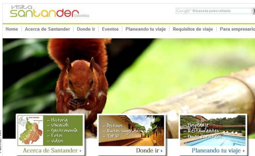
Portal interactivo con la oferta turística del departamento de Santander.

Para más información: www.visitasantander.com