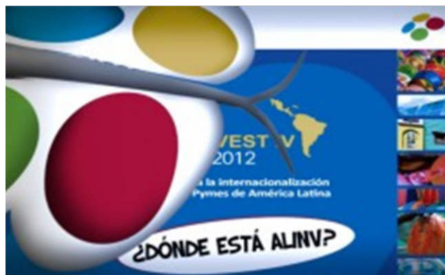
Nueva seña de identidad de AL-INVEST IV para la Región Andina.

http://www.youtube.com/user/alinvestIVcan