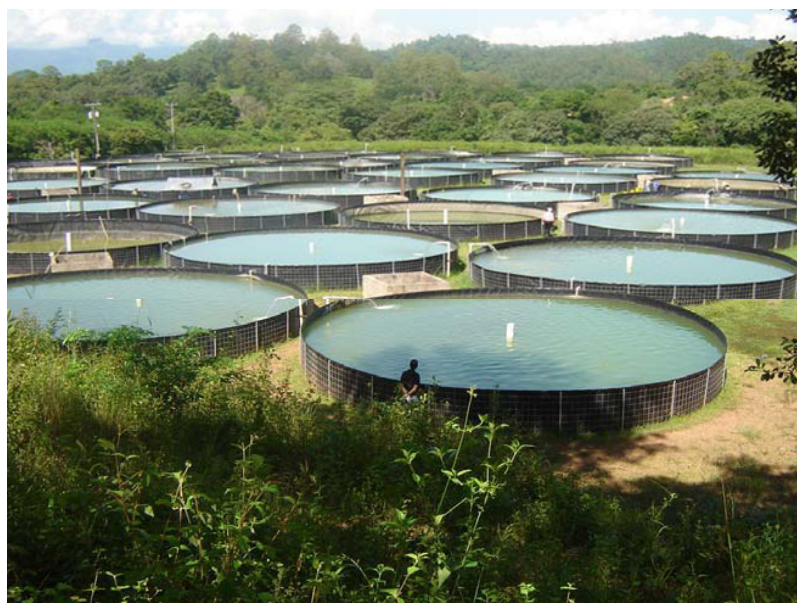
Sistemas de aeración acuícola

Solo en ese año, unas 2.000 empresas peruanas lograron exportar a la UE, de las cuales el 86% fueron PYMES.