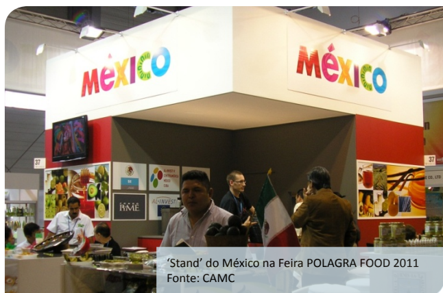
'Stand' do México na Feira POLAGRA FOOD 2011

Contato: Angélica Espina Tozcano angelica@eurocentro.mx