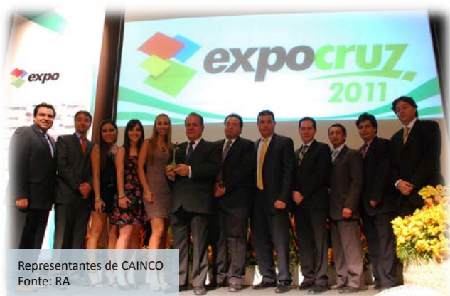
Representantes de CAINCO

24 de setembro 2011, Santa Cruz, Bolívia