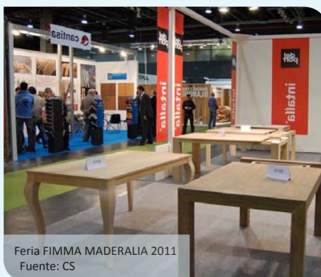
Feria FIMMA MADERALIA 2011

El mercado de la Unión Europea se posiciona como el mayor consumidor e importador de madera y productos asociados del mundo; posición que también ocupa en el mercado de los muebles.