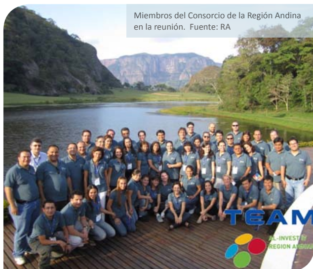
Miembros del Consorcio de la Región Andina en la reunión.

26-28 octubre, Santa Cruz de la Sierra, Bolivia