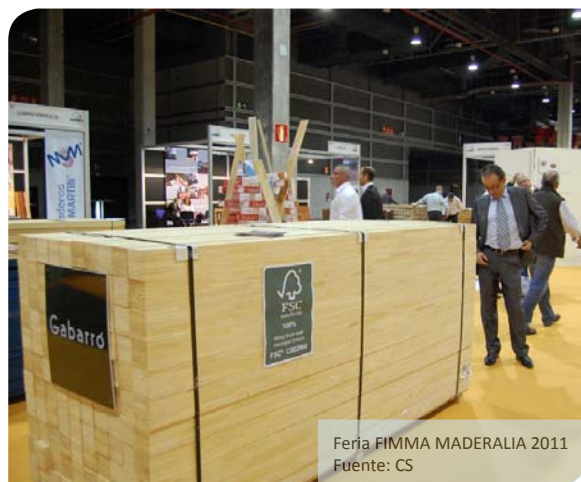
Feria FIMMA MADERALIA 2011

Contacto: Diana de Ávila Tordecilla ddeavila@cccartagena.org.co