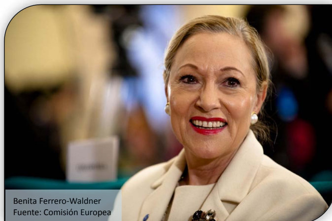
Benita Ferrero-Waldner