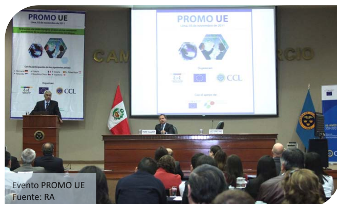
Evento PROMO UE